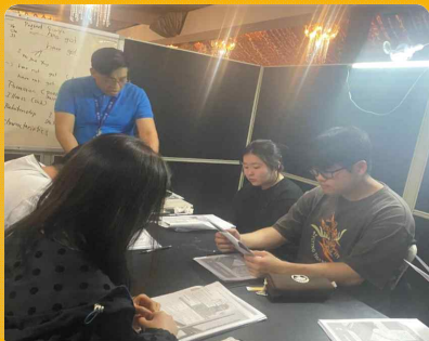
영어 집중 교육