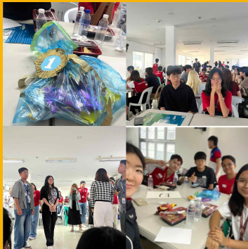
한국문화 교류, 인적교류